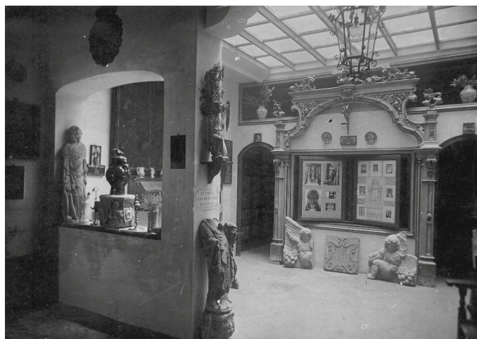
Sales de l'antic Museu de Cervera. ACSG. Fons Duran.

ambiciosos projectes arxivístics, arqueològics i museístics que va desenvolupar amb èxit tant a Barcelona com a Cervera, on la seva petjada no ha deixat mai de ser present.